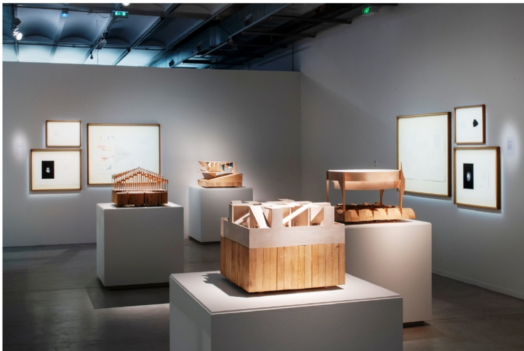
FRAC CENTRE - Exposition "ailleurs.....ou plus loin"